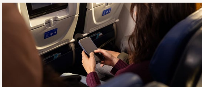
經濟艙 United Economy SM 免費 Wi-Fi 傳遞文字訊息