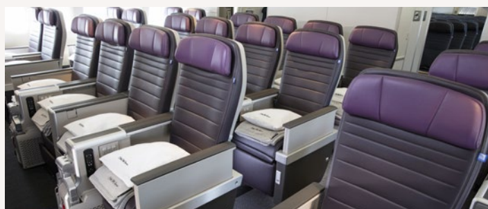
豪華經濟艙 United Premium Plus SM 享與商務艙同等級之備品